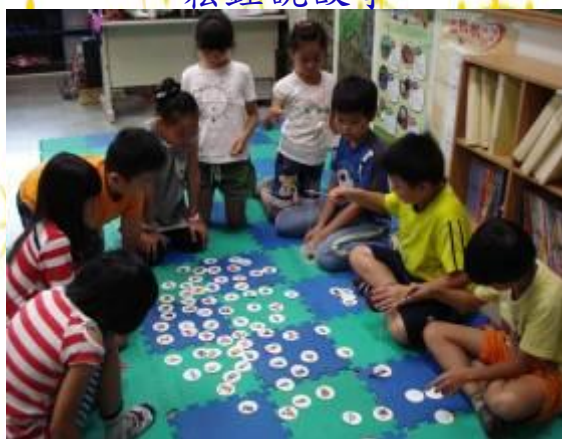
自然課—大家來釣魚