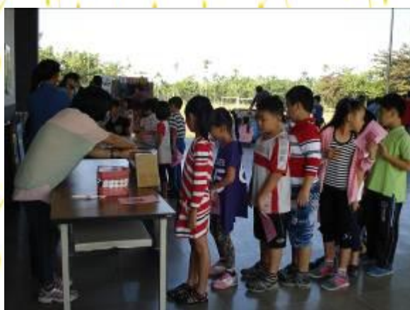
健康促進闖關活動