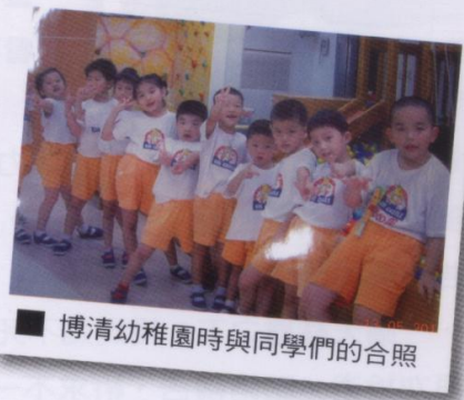
博清幼稚園時與同學們的合照