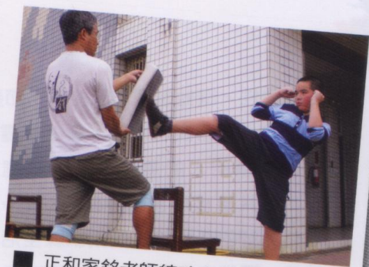
正和家銘老師練功夫的博清