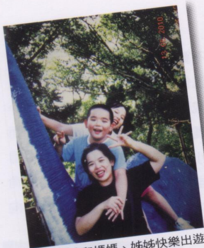
■ 博清和媽媽、姊姊快樂出遊