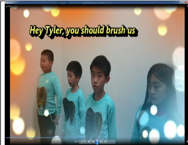
牙齒跳出來告訴泰勒要潔牙