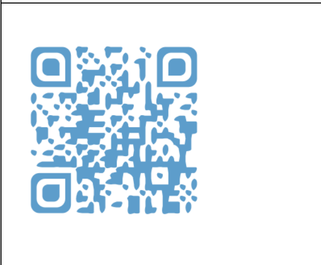
製成 QR code