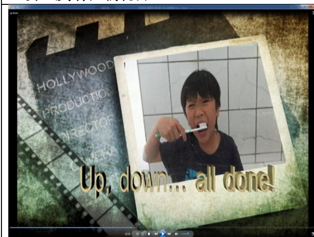
泰勒的招牌口頭禪