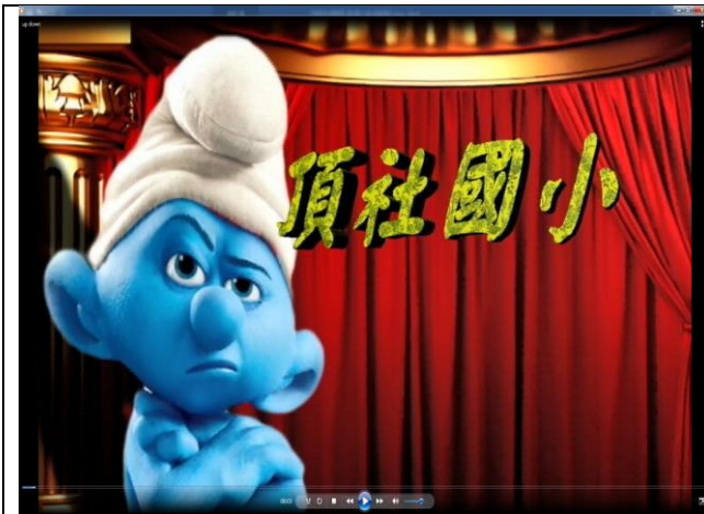
參與全國戲劇競賽