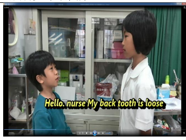
護理師與泰勒對話