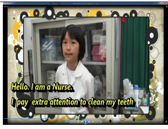
扮演護理師進行衛教