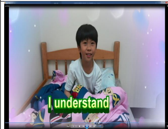
泰勒明白刷牙的重要