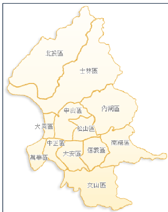
12 行政區地理位置關係圖示