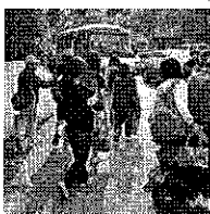
聽聞女學生遭誘拐，昨放學時不少家長到校接送。圖中學校與此案無關。

【呂品逸、曾佳俊/新北報導】留意拐騙擄學童新手法！新北市出現一名假冒檢察官的男子，日前在樹林區以調查校園霸凌為由，打算誘騙一名國中女學生上車，所幸女學生機警不予理會，還趕緊告知師長。新北市教育昨表示，校方獲悉後已通報反映，為保障學子安全，緊急發文通知新北市各校並進行安全宣導，提醒家長及學童提高警覺。