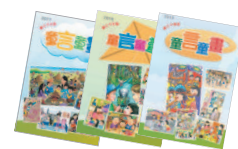
「溫馨家園」童言童畫入圍作品集