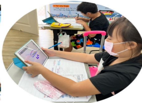
說明：閱讀寫作結合數位學習—人物表情及動作之寫作練習