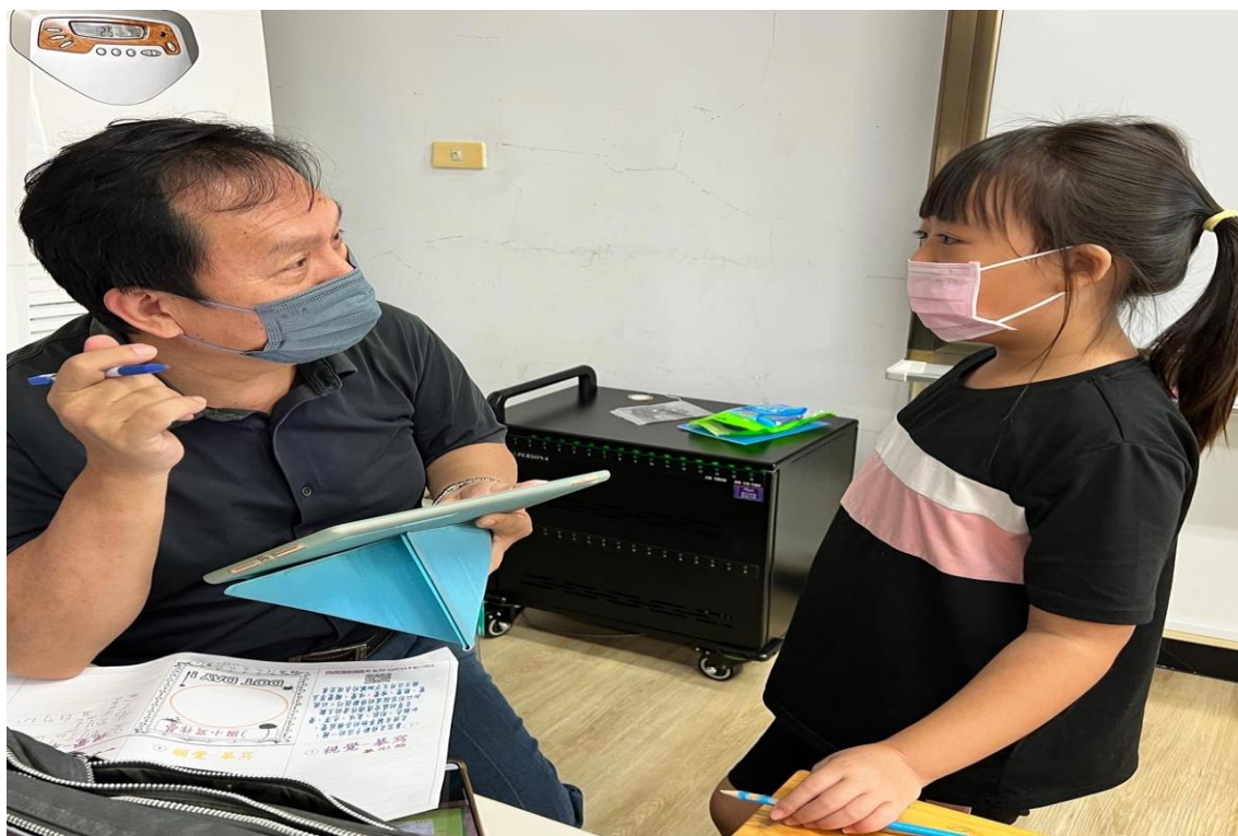
說明：寫作指導及口說練習-試著說出自己所感、所寫