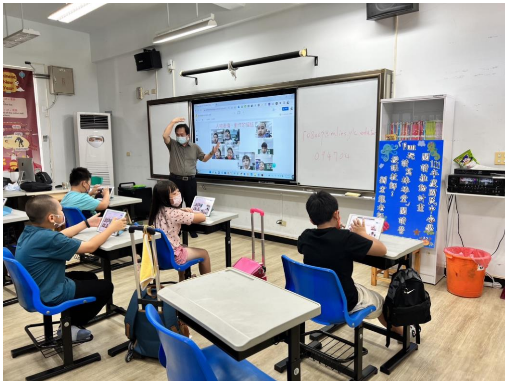
說明：閱讀寫作結合數位學習—人物表情及動作描述