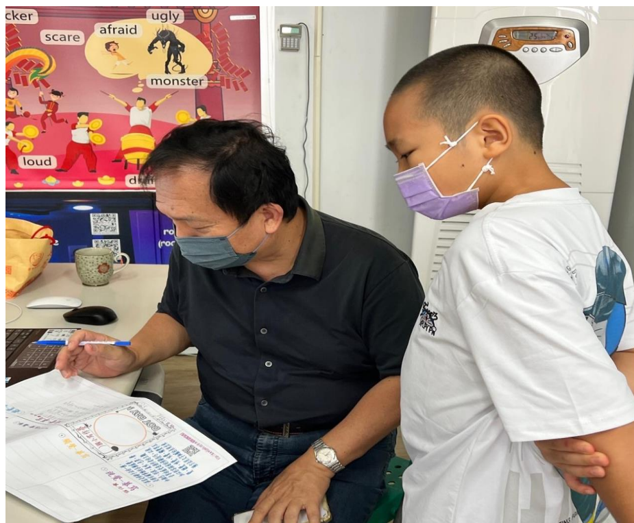
說明：教師指導寫作中-視覺摹寫