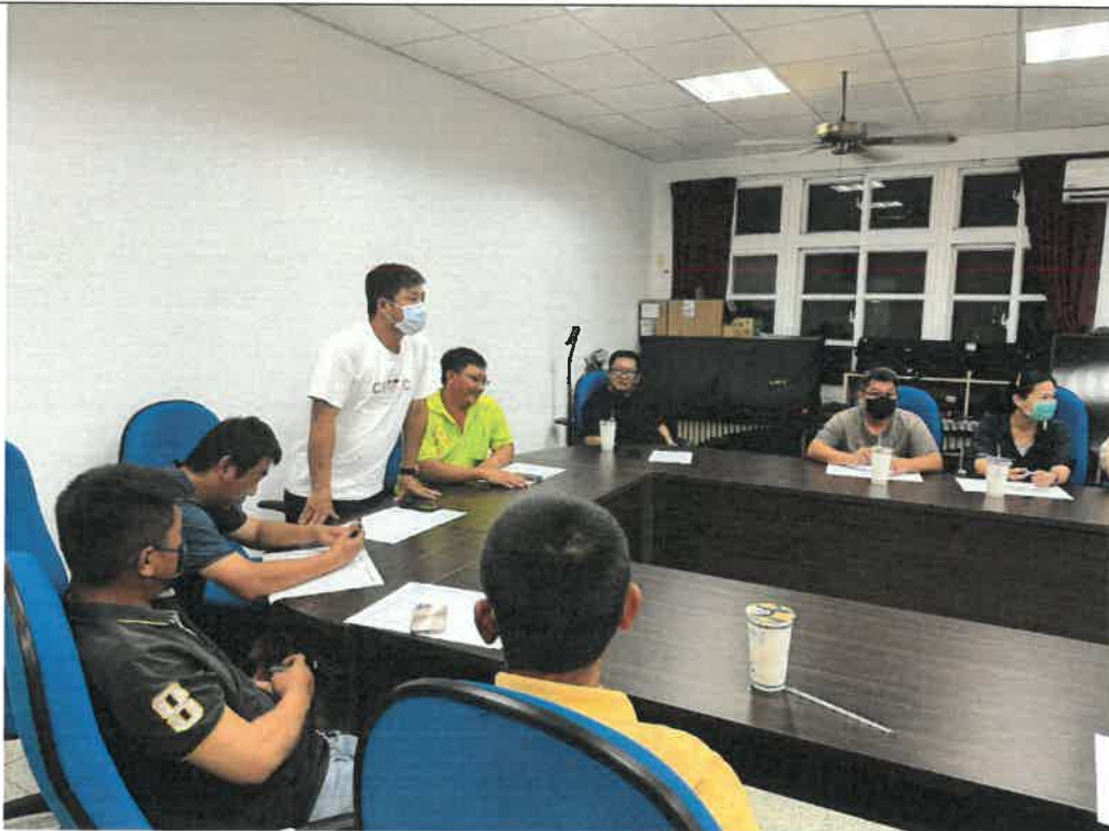
照片說明：現任會長報告中