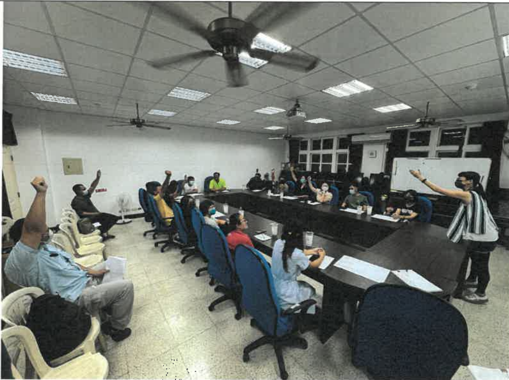
照片說明：委員會重組票選中