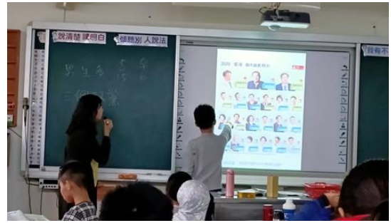
▲觀察臺灣縣市首長圖，學生指出性別、政黨的比例差異。