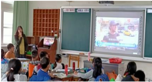
▲從外國人的角度來看臺灣選舉，引起學生關注選舉現象、分享經驗。