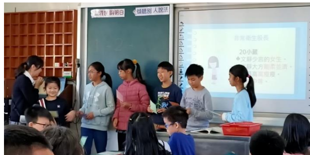
▲非常幹部卡牌遊戲，讓學生猜測誰才是真正的班級幹部。體驗受條件限制的選舉，就如同女性受到社會框架影響參政的現象。