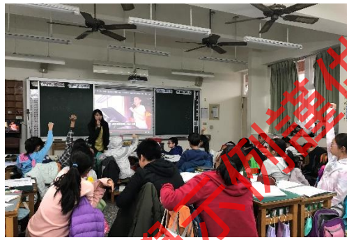
←透過女性參政者訪談影片，討論性別刻板印象以及不平等現象