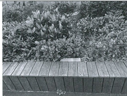
羔羊跪乳區(六乙掃區)