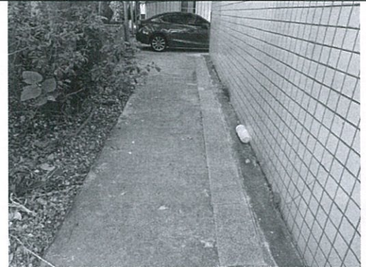
B棟後面教師車棚(三乙掃區)