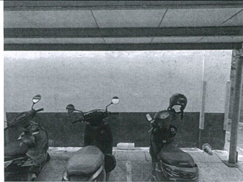
B棟後面教師車棚(三乙掃區)