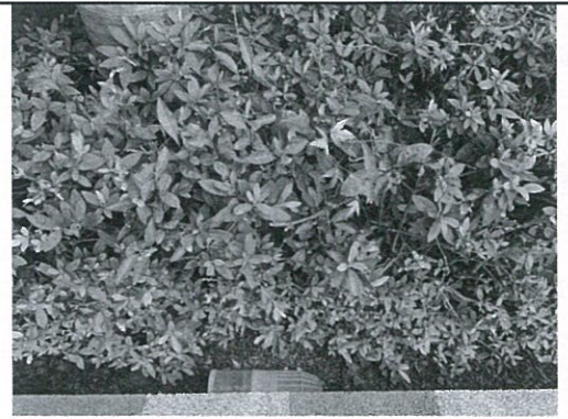
A棟辦公室後面花園(三甲掃區)