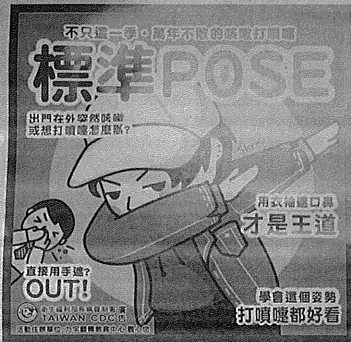
預防新冠病毒學校園宣導系列一 配合宣導單位: 力手翻譯學習教育中心 資料來源: 衛生福利部疾病管制署官網