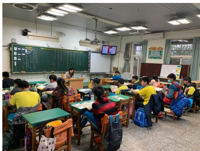
說明：學生認真聽講。