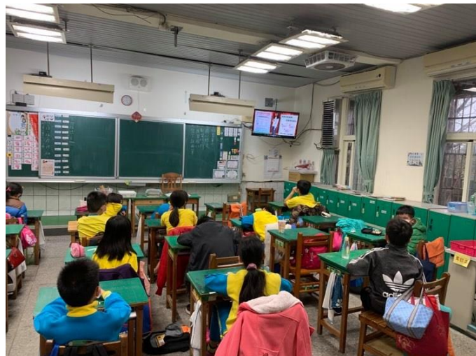
說明：學生認真聽講。