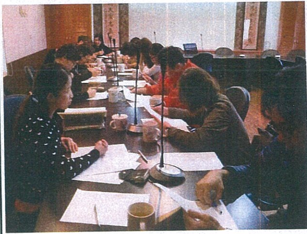
午餐執秘業務報告