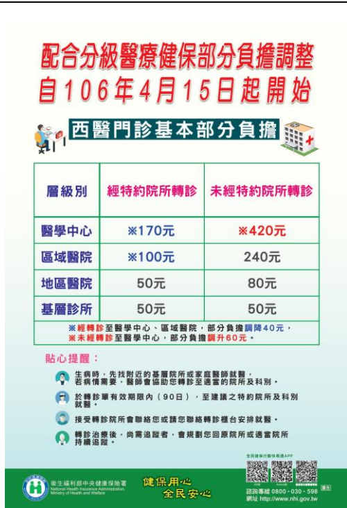
說明：全民健保教育海報。