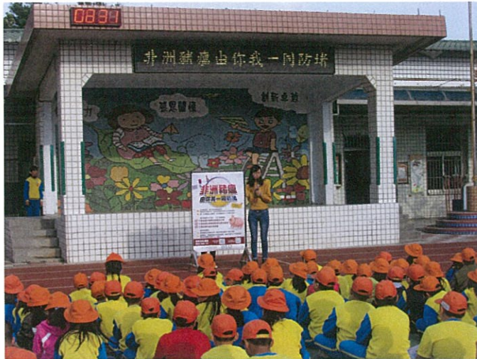
說明：學生認真聽講。