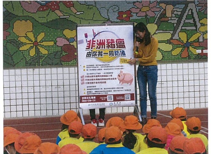
說明：講解相關法條。