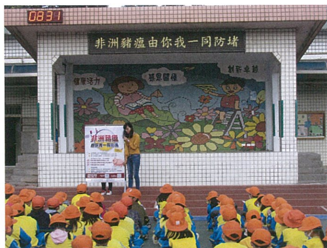
說明：進行問題提問。