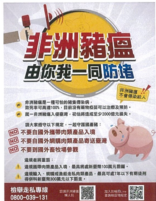
說明：傳染病防制教育海報。