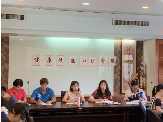
說明：期初健康促進會議校長報告。