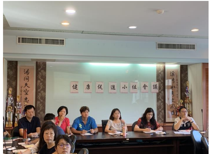
說明：期初健康促進會議學務主任報告。