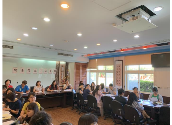
說明：召開期初健康促進會議。