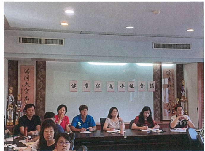
說明：期初健康促進會議學務主任報告。