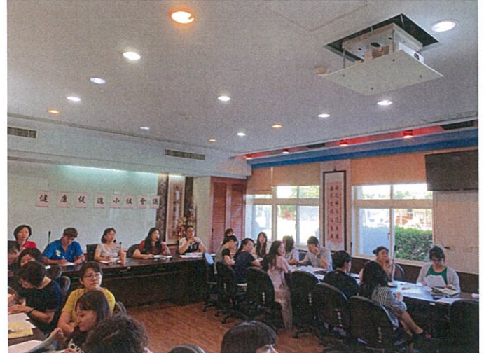
說明：召開期初健康促進會議。