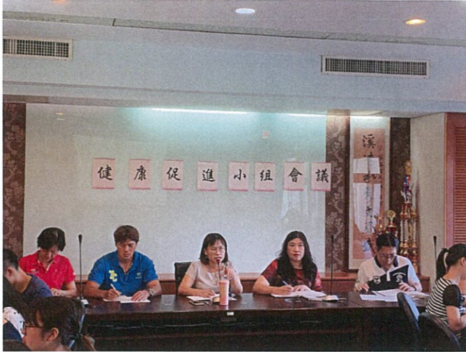
說明：期初健康促進會議校長報告