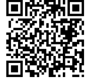
桃園市公立及非營利幼兒園 招生系統