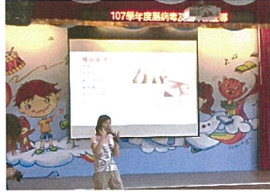
腸病毒&登革熱宣導