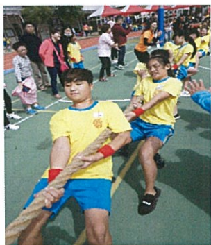
校慶暨社區運動會