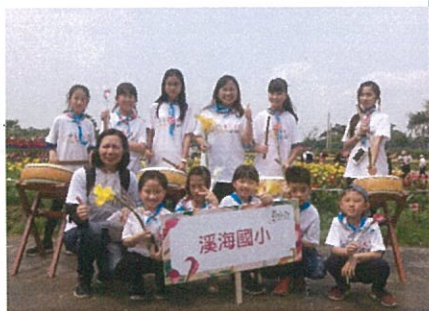
戶外教育-溪海花卉園區