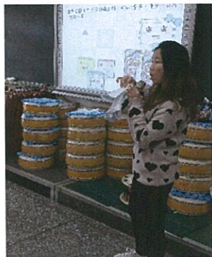
高年級生理衛教宣導