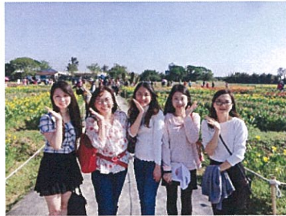
環教研習-大園彩芋季