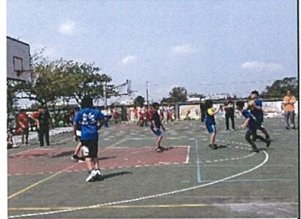
學生三對三籃球賽