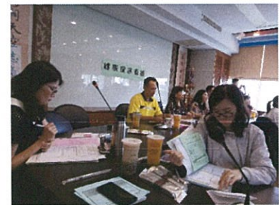
健促小組工作會議