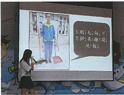
正確使用掃具宣導