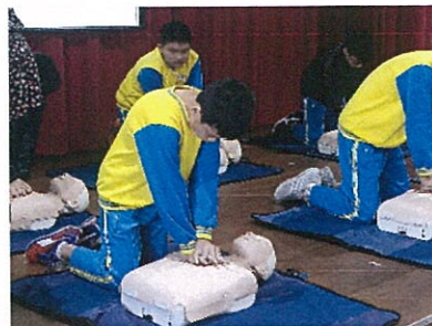
六年級 CPR 教學