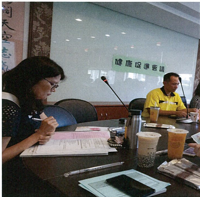
說明：上學期期初健康促進會議