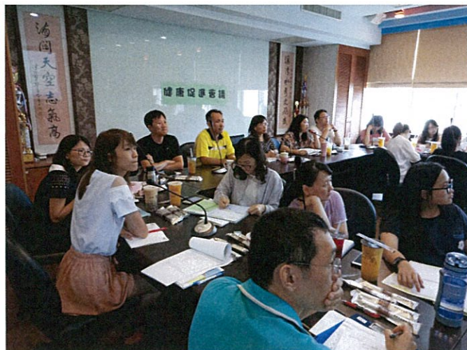
說明：衛生組期初報告項目。