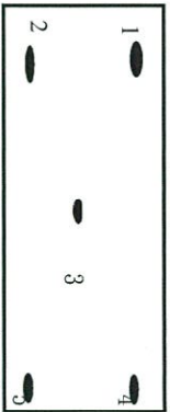
圖二黑板部分測量位置圖(測量面:黑板面垂直度)

依圖2之位置以黑板面為基準,使用照度計所得之照度值(LUX)記錄於表上,再以各值之和除以5,則為平均值.