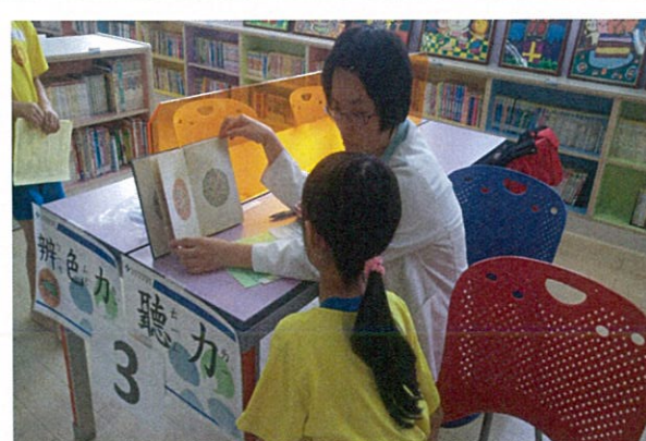
照片說明：辨色力檢查