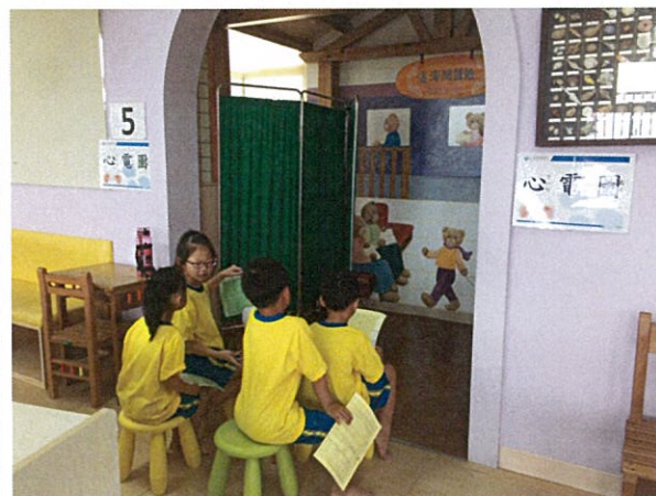
照片說明：新生心電圖檢查