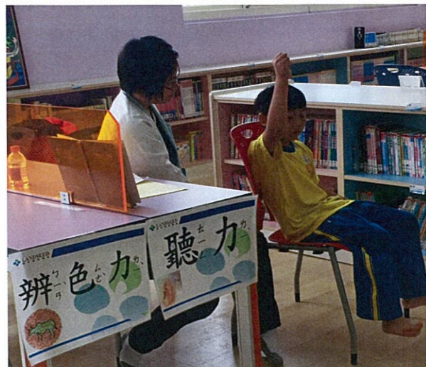
照片說明：以音叉聽力檢查