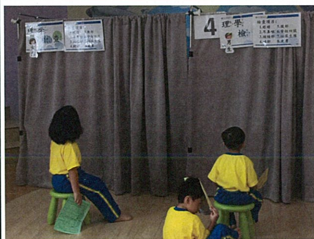
照片說明：理學檢查