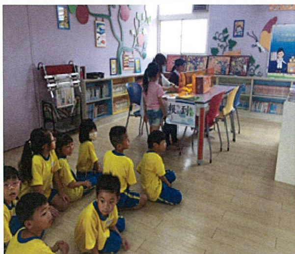
照片說明：學生健檢前報到核對資料