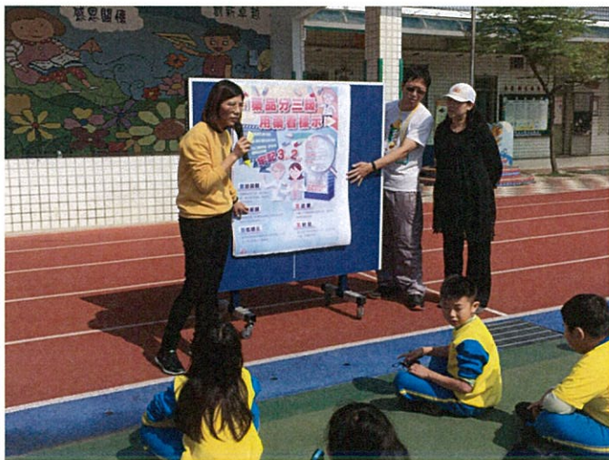
知道藥物濫用對身體的危害