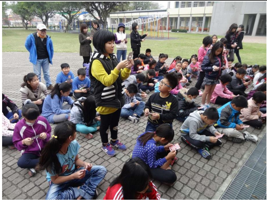
結合賓果遊戲進行競賽