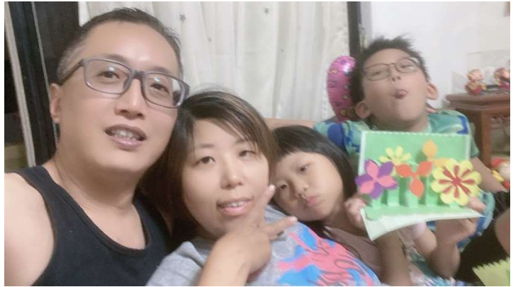
中年級教師設計愛家教育課程，學生製作母親節卡片感謝家人的付出與照顧。