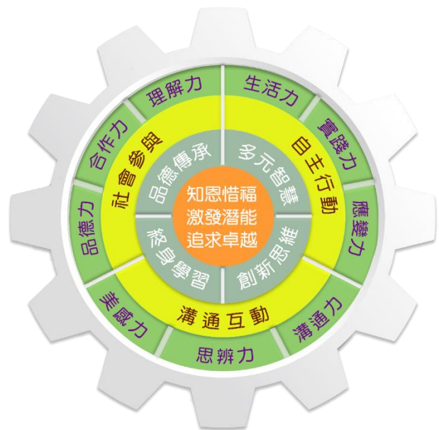
再興小學課程願景圖

在學校願景引領下，課發會委員透過願景意涵，訂定「品德傳承、創新思維、多元智慧、終身學習」做為課程願景，在此願景架構下，擬定本校課程目標為「孕育高尚品德，豐富生命內涵」、「邁向數位學習，胸懷國際視野」、「啟發多元智慧，落實五育均衡」、「深耕學科知識，樂於終身學習」，並融合十二年國教三面九向內涵，以呼應學校願景，發展再興特色課程，培養「好品格」、「好體能」、「愛閱讀」、「樂學子習」的再興學子。