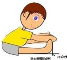
柔軟度：坐姿體前彎

二、相關資訊可參考教育部體育署體適能網站： http://www.fitness.org.tw/