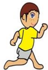
心肺耐力： 800/1600公尺跑走