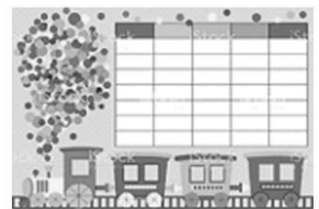
數學領域：成長的足跡