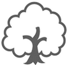
健康與體育領域(健康)： 環保愛地球