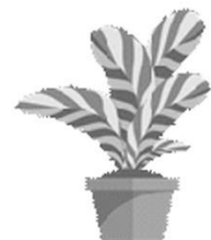
自然領域： 有什麼不一樣？