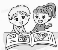
語文領域(閱讀)： 寒假閱讀趣