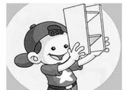
自然領域： 自製潛望鏡