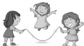
健康與體育領域(體育)： 跳繩樂趣多