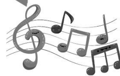
藝術與人文領域(音樂)： 音樂欣賞