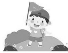
數學領域： 達人帶路暢玩○○(地名)