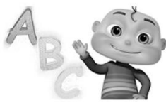
語文領域(英語)： Fun with Reading