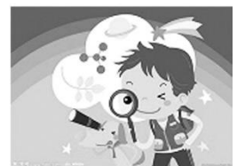
社會領域： 先民的開發故事