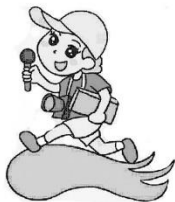
語文領域(國語)： 小记者報導