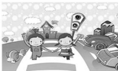
交安小達人修練趣