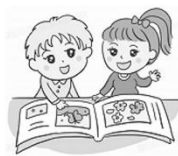
語文領域(閱讀)： 寒假閱讀趣