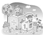
數學領域： 乘法動動腦