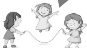
健康與體育領域(體育)： 繩乎奇技