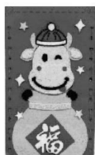
語文領域： 牛牛紅包DIY創作