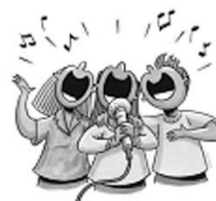
藝術與人文領域(音樂)： 歡樂新年