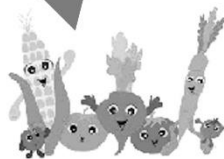
健康與體育領域(健康)： 健康年菜DIY