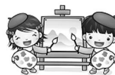
藝術與人文領域(美勞)： 自在揮灑創意