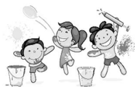
生活領域： 2021煥然一新