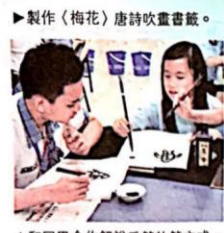
▶製作《梅花》唐詩吹畫書籤。 ▲和同學合作解說毛筆執筆方式。