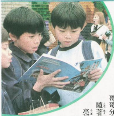
▲展覽剛買的書。 ▲展讀剛買的書。

在二月中旬舉行的臺北國際書展是一年一度的閱讀盛事，再興小學教師帶領學生參與「主題館闖關體驗」，勇闖如迷宮般的書展展館。穿梭展館破關趣 領取闖關集章卡後，學生前往六大特色主題館闖關集章。「書展大賞館」展示得獎好書，要依照關卡指示找出書中的答案，考驗學生閱讀能力；到了「波隆那30主題館」，學生一邊欣賞三十五位插畫家入選波隆那插畫展的作品外，一邊闖關——只要記住兩位得獎插畫家的名字，就能順利通關。 逛書展兼闖關時，有學生參加「幻境漫遊」(AR)創作數位體驗展的擴增實境 (AR) 體驗，可以感受摩托車馳騁大街小巷的快感，並進入幻境漫遊咖啡廳，和漫畫人物一起喝下午茶！ 讀書買書好滿足 書展讓愛書的師生都心滿意足。學生觀非開心的說：「我看到作家的簽書會，還買了閱讀老師推荐的《二十封想念》，和一些科學類、傳記類的書。」學生照簿則分享：「我看到很多喜歡讀書，因為有些書不會看第二次，所以很猶豫要不要買，最後買了老師介紹過的《解碼男孩》，準備回家跟哥哥分享。」 隨著數位時代來臨，學生亮仔本來很擔心閱讀人口下降，「但看到書展會場人山人海就安心了！」最後師生相約：明年再來尋寶！