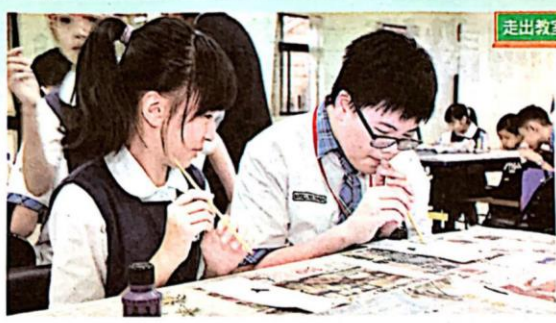
▲教印尼學生操作布袋戲偶。 ▲體驗古早童玩。