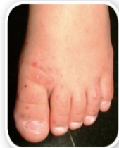
足部有無出現小紅疹