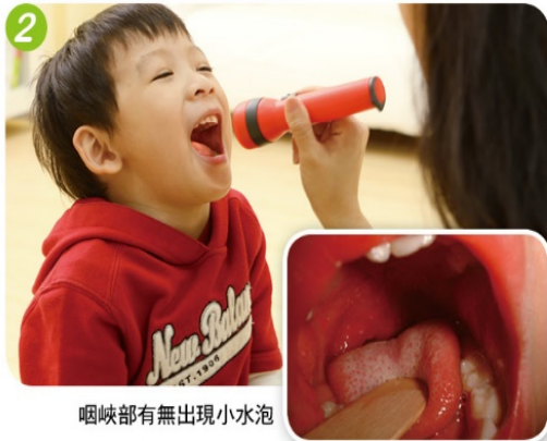
咽峽部有無出現小水泡