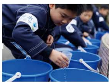
小朋友體驗節水去洗水。

只用600毫升水 2017-03-17 18:33 Liberty Times Net 【記者楊錦傑 / 台北報導】根據統計，世界上每11個人，就有1人缺乏乾淨水可用，每年更有84萬人死於不乾淨的水引發的腹瀉。在3月22日世界水資源日前夕，再興國小透過推廣節水知識、分享節水密招，甚至更親自力行節水，呼籲大眾重視水資源短缺問題，也為世界上缺水的兒童發聲。