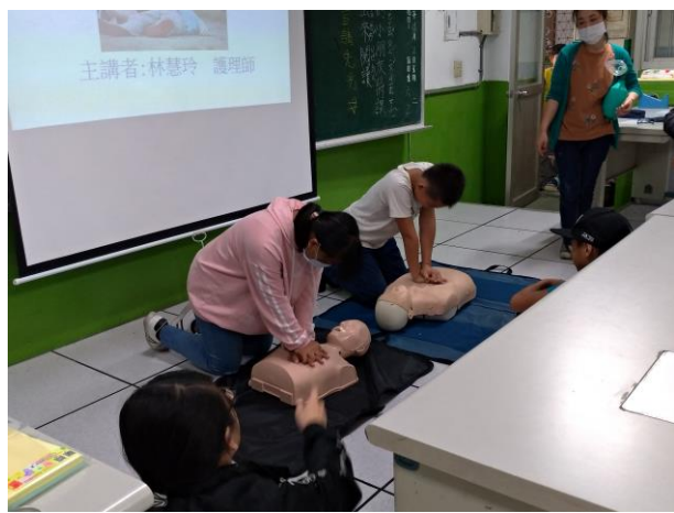
六年級實際示範操作及個別指導(六乙)