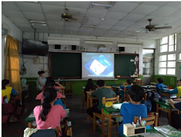
五年級 CPR 影片宣導及 AED 介紹(五乙)