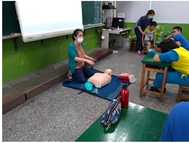
六年級實際示範操作及個別指導(六甲)