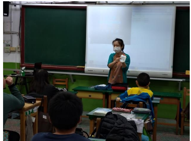
五年級 CPR 影片宣導及 AED 介紹(五乙)