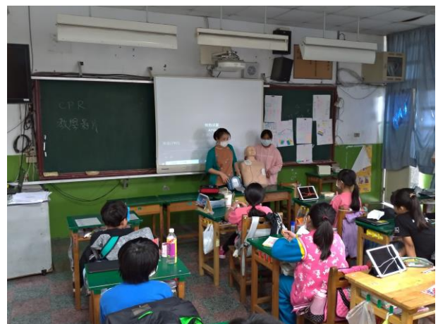
五年級 CPR 影片宣導及 AED 介紹(五甲)