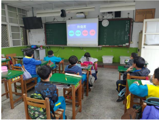
四年級熱傷害介紹(四甲)