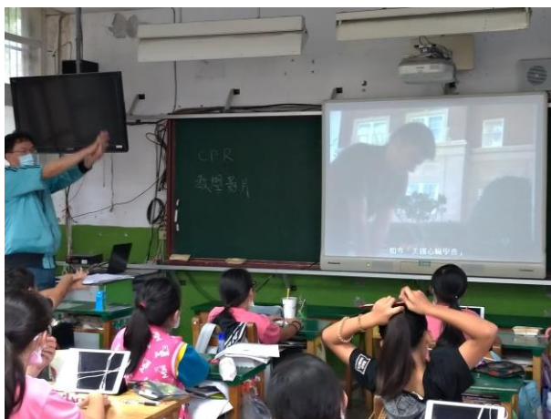
五年級 CPR 影片宣導及 AED 介紹(五甲)