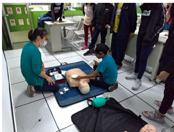
六年級實際操作 AED(六乙)