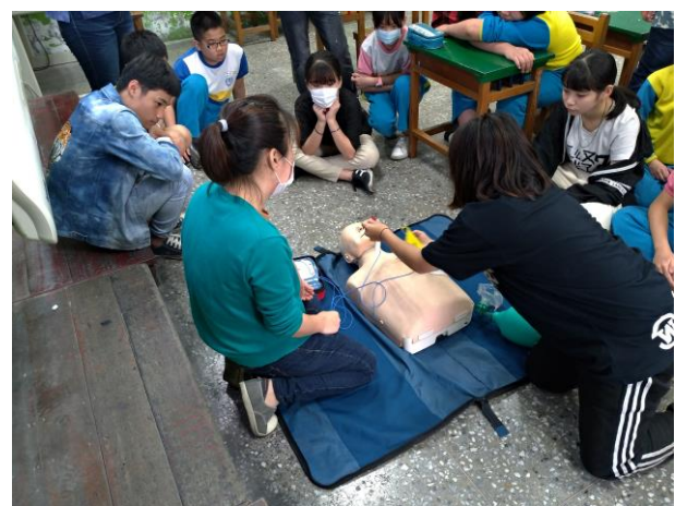
六年級實際操作 AED(六甲)