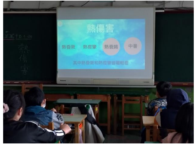
四年級熱傷害介紹(四乙)