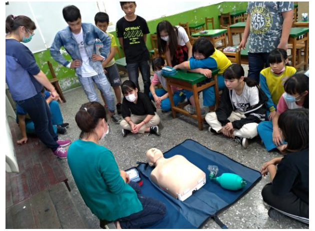
六年級實際示範操作及個別指導(六甲)