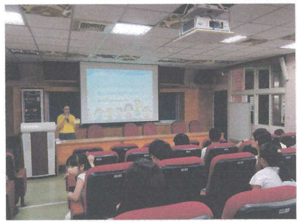
學校日向家長說明家庭防災卡的重要性