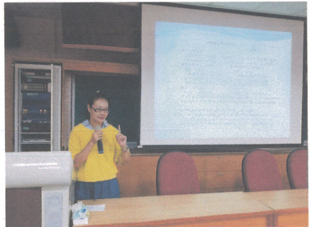
學校日向家長說明如何填寫家庭防災卡