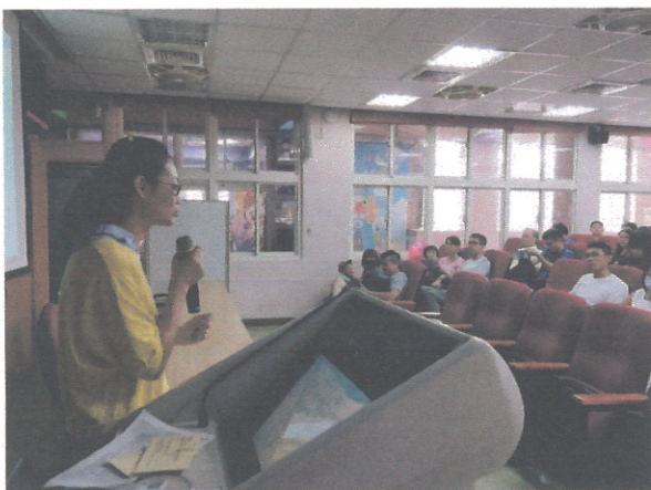
宣導如何使用家庭防災卡及 1991 留言平台