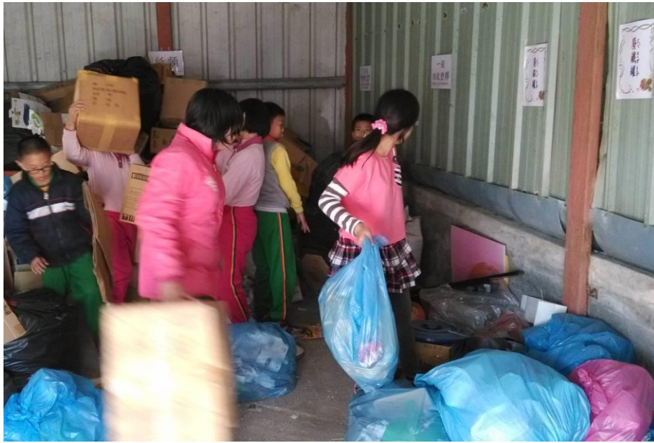
每週三實施全校資源回收