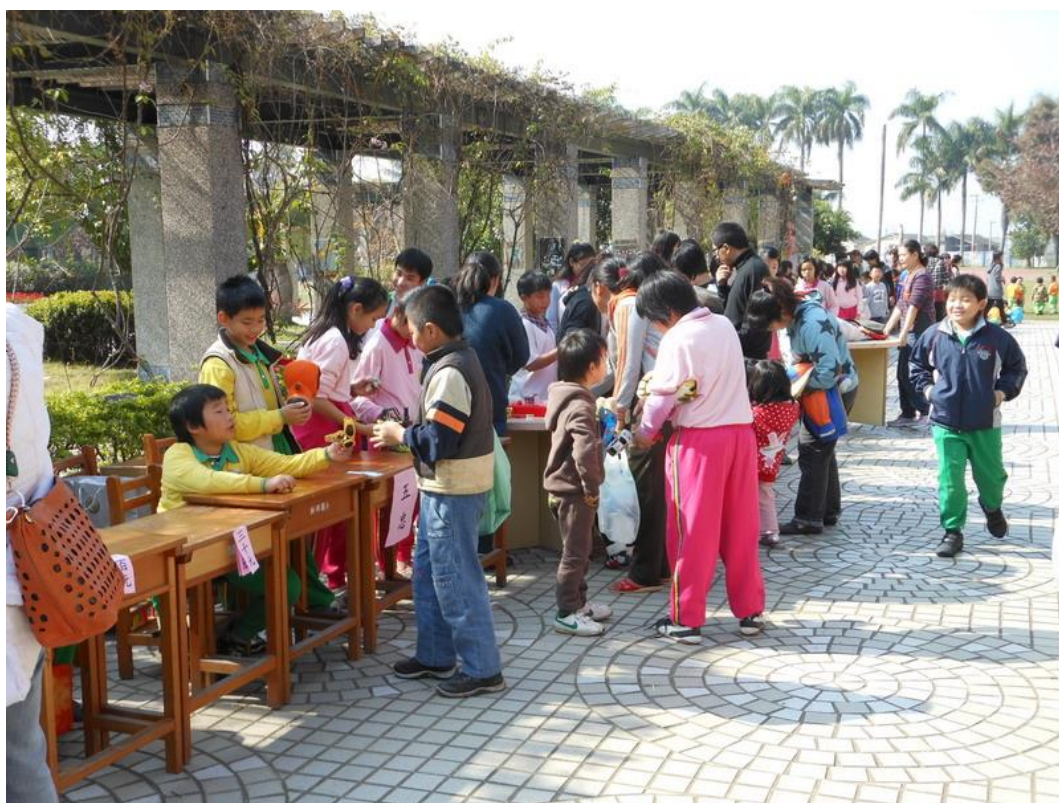
學期末舉辦跳蚤市場義賣