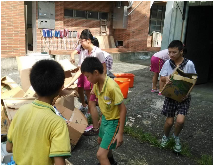
由環保隊協助全校性資源回收