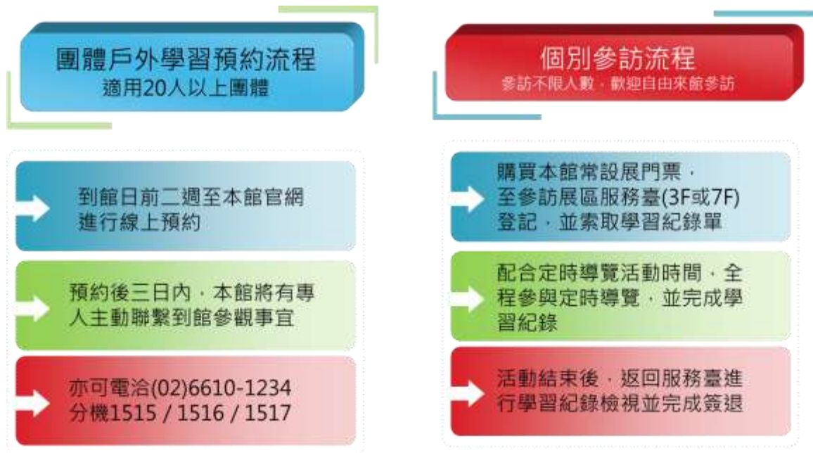
圖三 環境教育課程活動預約流程