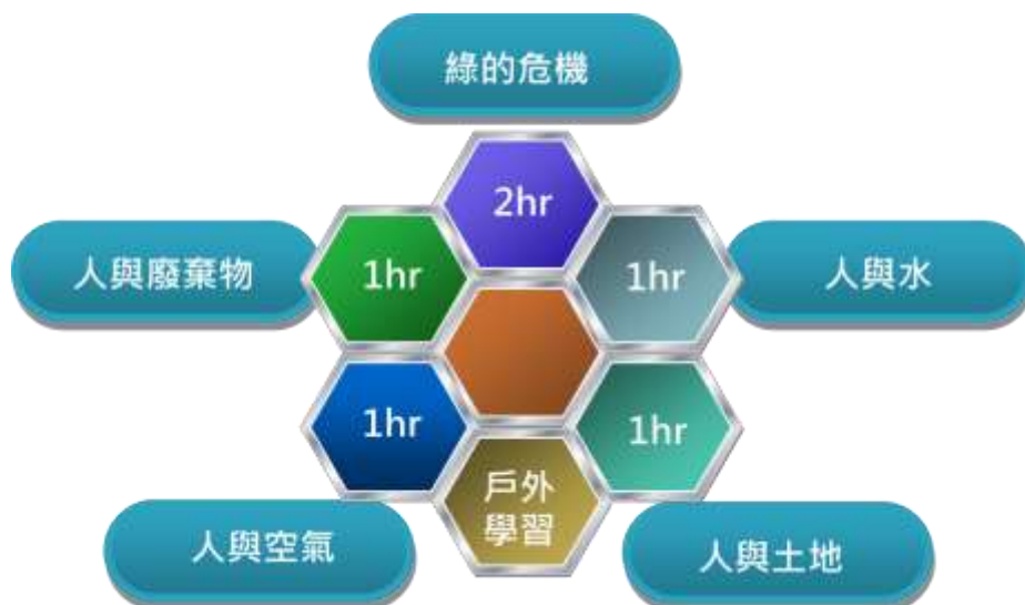
圖二 戶外學習環境教育課程方案