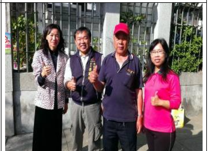
協請交通局及吉龍里里長會勘設置標誌或號誌改善學校通學環境 (北側門)