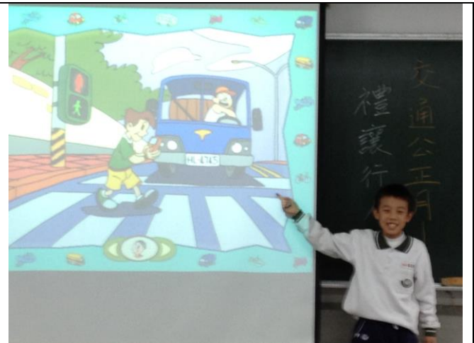
中年級老師進行交通違規事件宣導與討論。