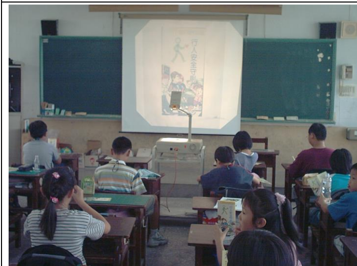
高年級老師進行交通違規事件宣導與討論。