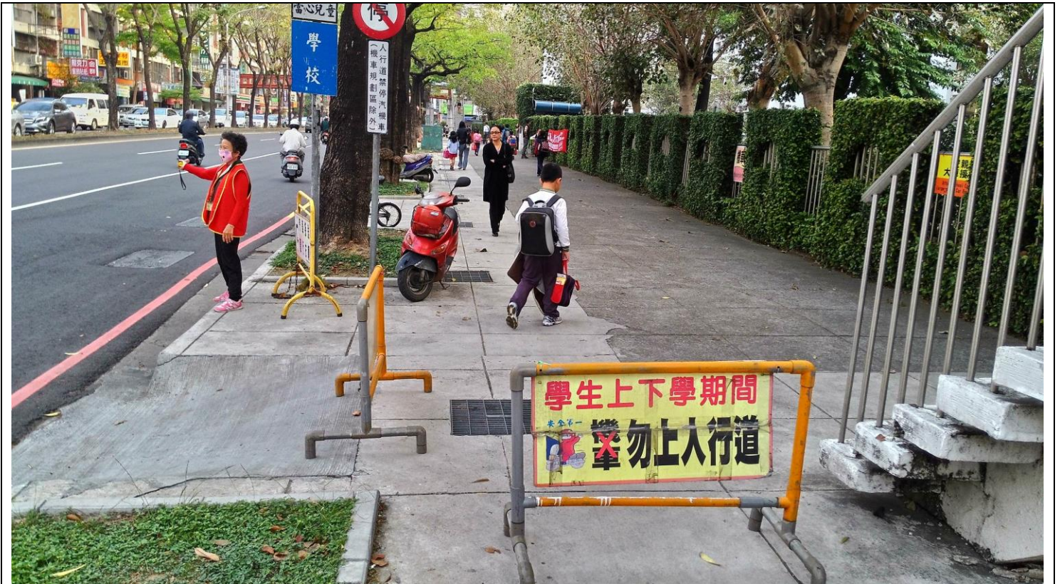
活動說明：忠明南路、南屯路口導護志工執勤實況。