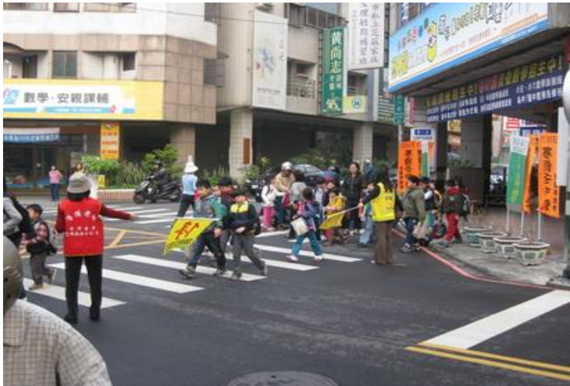
活動說明：五權七街、五權西六街口導護志工執勤實況。