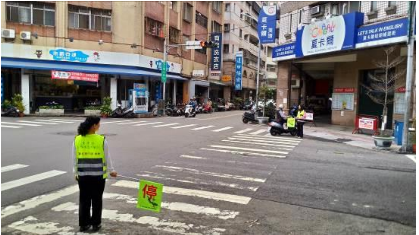
活動說明：五權七街、五權西五街口導護志工執勤實況。