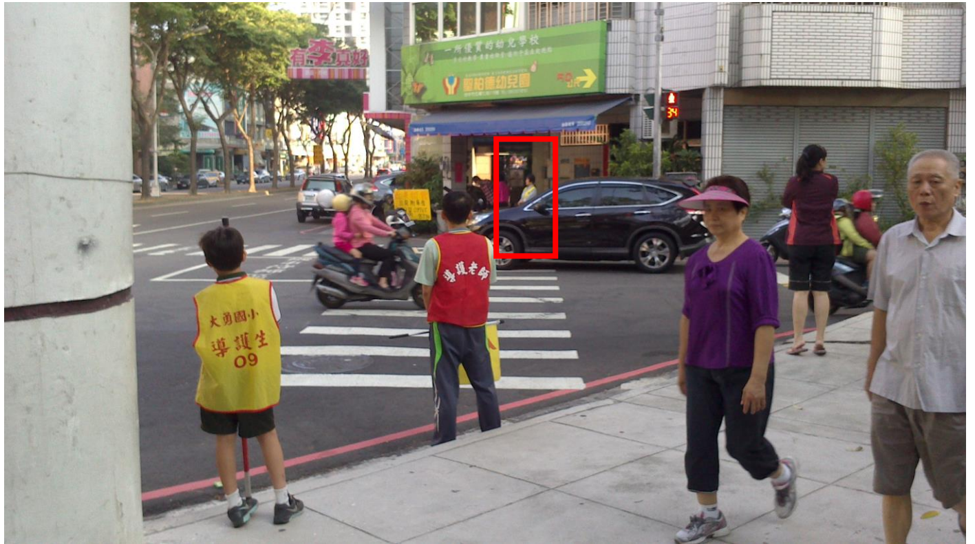
活動說明：五權七街與忠明南路口導護志工執勤實況。