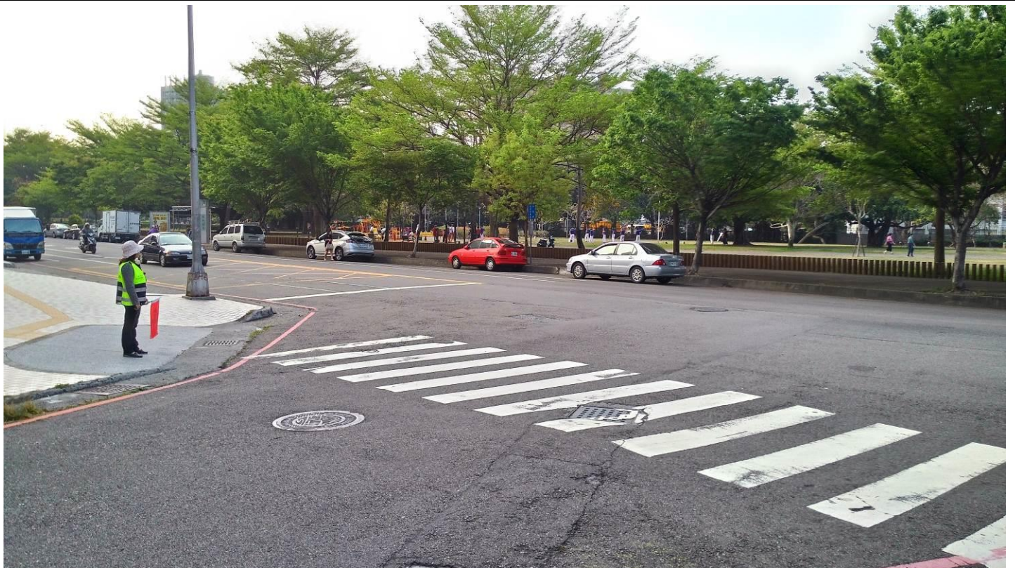
活動說明：南屯路之靜和醫院路口導護志工執勤實況。