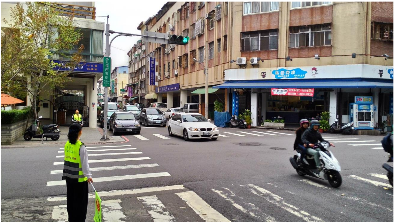
活動說明：五權七街、五權西五街口導護志工執勤實況。