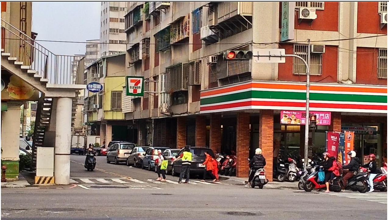
活動說明：五權七街與忠明南路口 7-11 導護志工執勤實況。