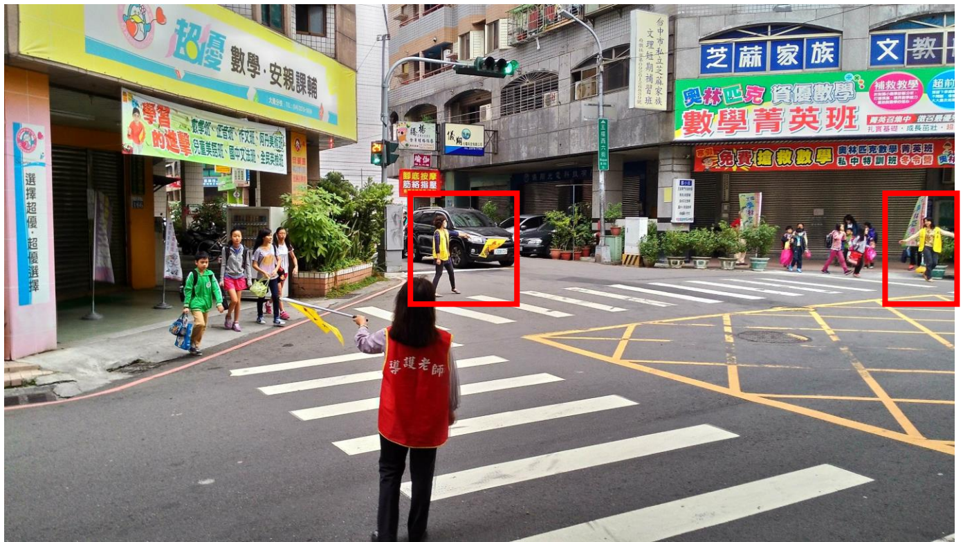
活動說明：五權七街、五權西六街口導護志工執勤實況。