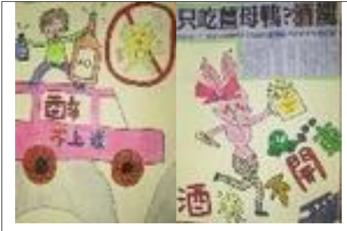
活動說明：學生作品集 1