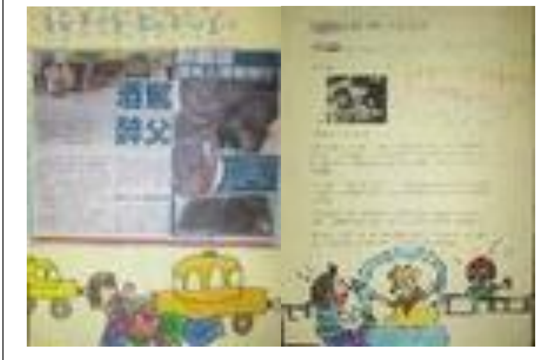
活動說明：學生作品集 2