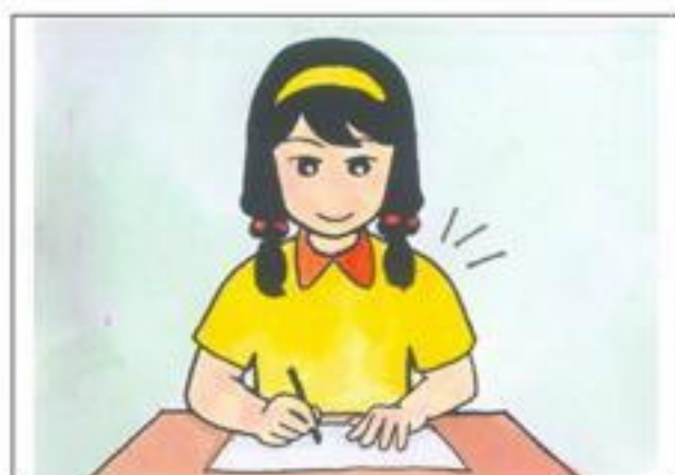
☉ 兩肩平・放輕鬆・歡喜來寫字