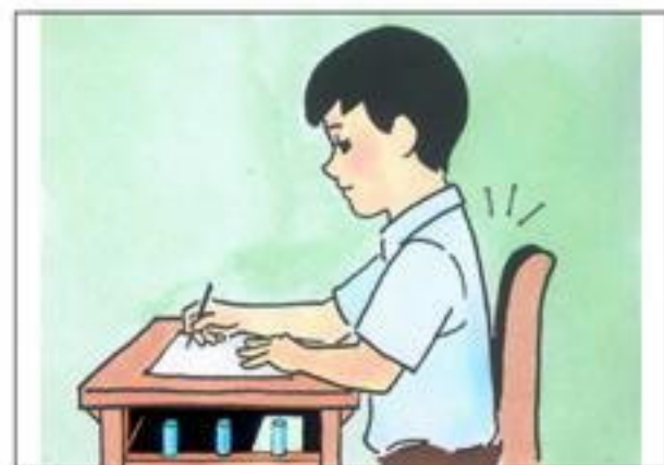
☉ 學寫字・坐端正・腰打直