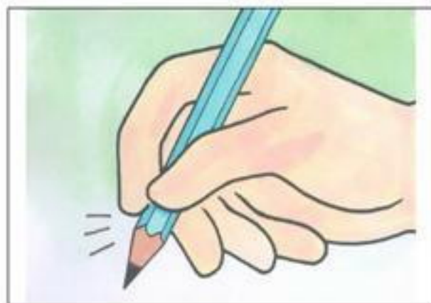
☉ 大拇哥・二拇弟・中指來挺筆