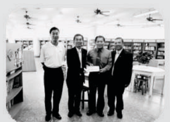
大里扶輪社捐贈圖書 款項壹萬元整