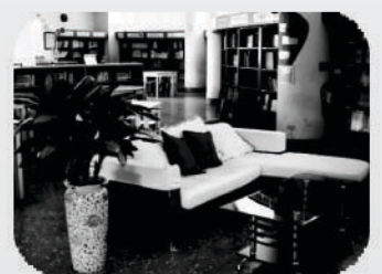
圖書室教學研究區 舒適沙發