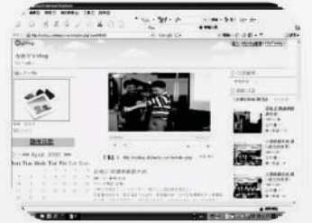
503班級閱讀短劇 展示網頁