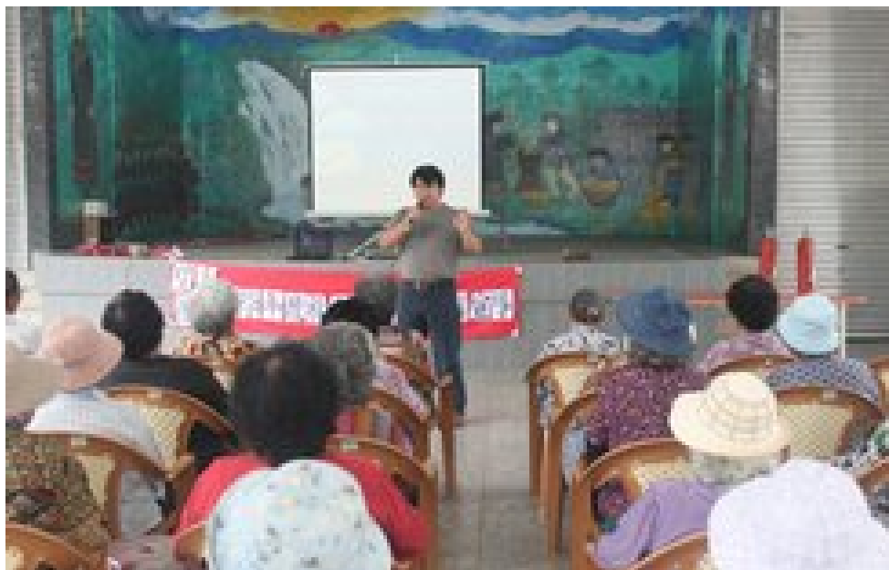
照片說明：社區防災宣導情形