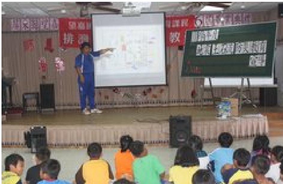
照片說明：逃生路線說明