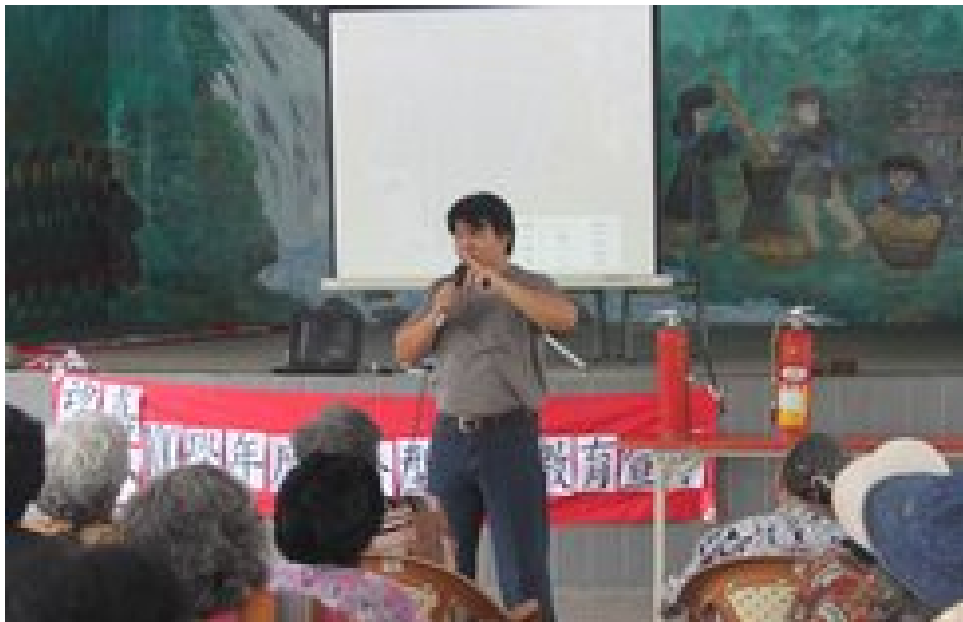
照片說明：社區防災宣導情形