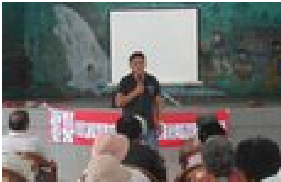
照片說明：社區防災宣導情形