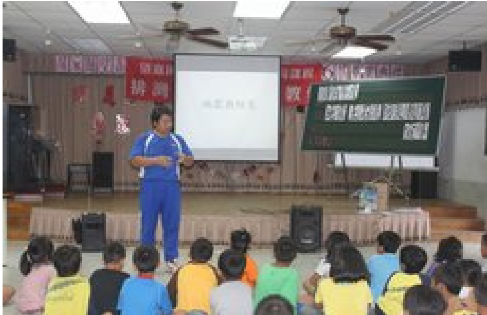
照片說明：訓導組長紀師說明防災工作之重要性。