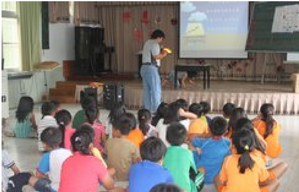
照片說明：紀老師說明防震逃生自救方法