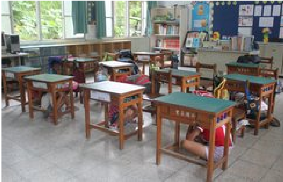
照片說明：防震演練情形