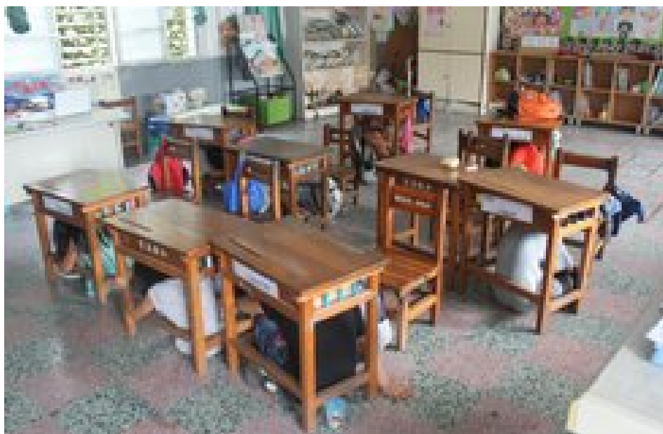
照片說明：防震演練情形