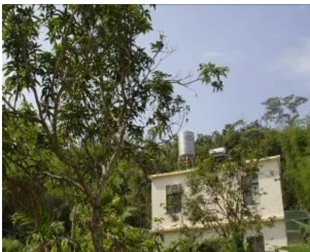
學校空地規劃作物栽培區種植芒果樹

校區依山勢而建，校園分成靜態學習區與動態學習區，可同時進行不同形態之學習，營造良好學習環境。