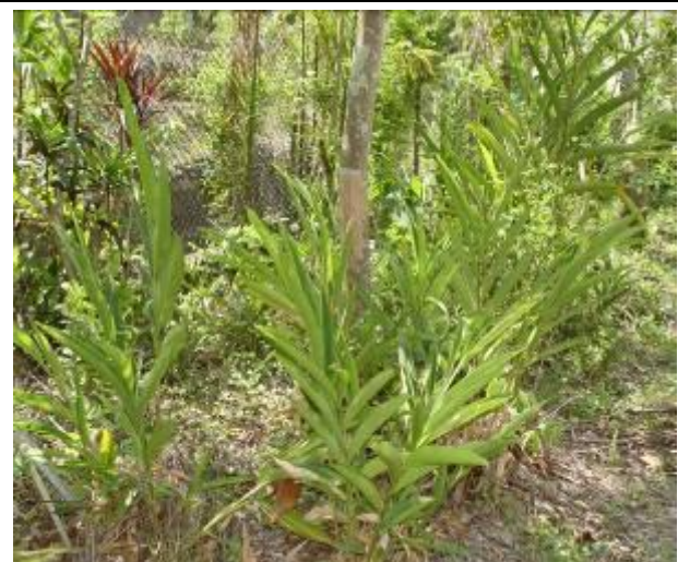
學校空地規劃作物栽培區種植月桃葉