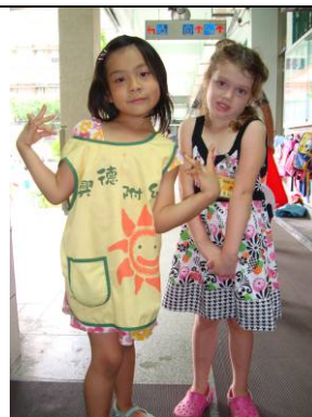
我盡力做好大太陽的責任