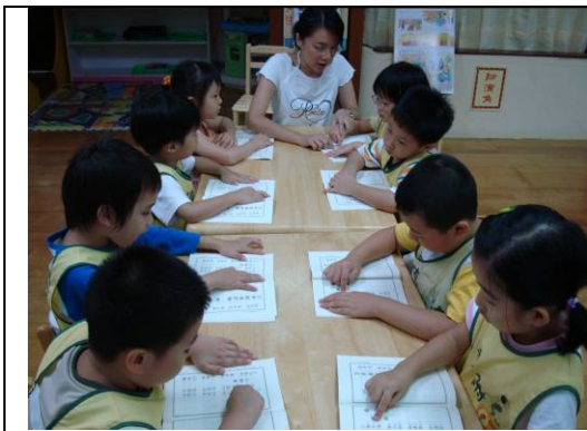
小朋友專注的讀弟子規

下學期開學初，舉辦讀經闖關暨筷子夾物活動，設計好玩又有趣闖關活動，提高孩子們對讀經的興趣。