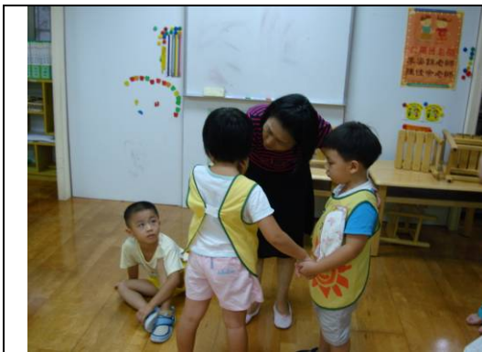
大太陽與小太陽的配對

實踐悌道的具體方法，大太陽就是指大班的孩子，小太陽就是中班的孩子。配對之後，就賦與大太陽要照顧小太陽的任務。