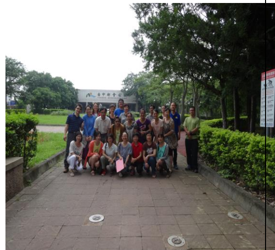
環境教育研習（都會公園）