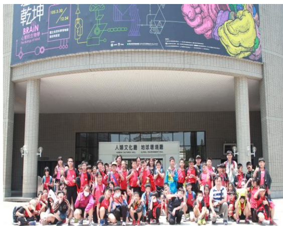
科博館校外教學參觀