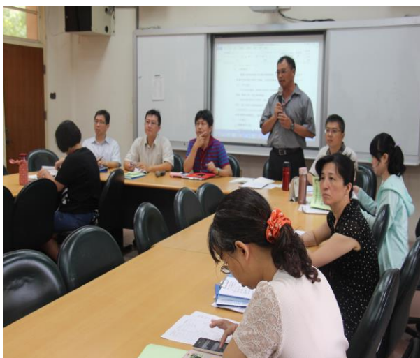
副指揮官工作說明