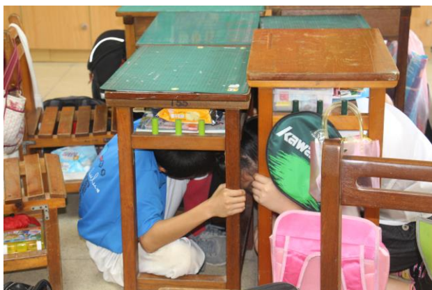
地震地震!就地避難掩護。