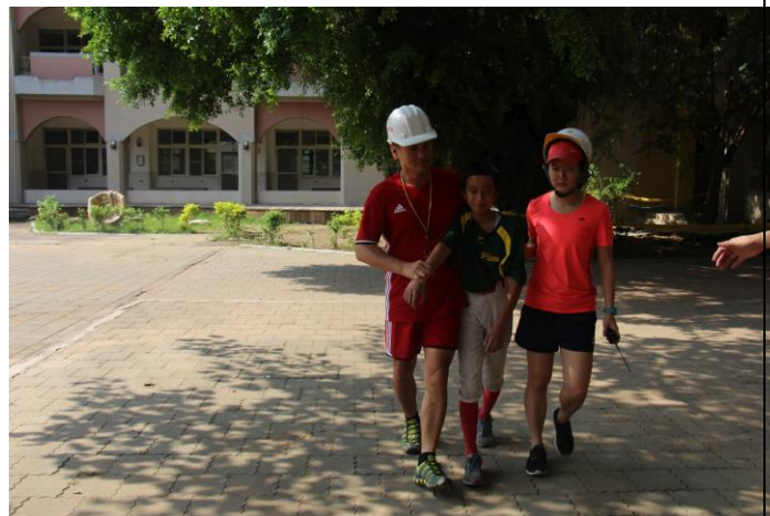
搶救組搶救受困學生。