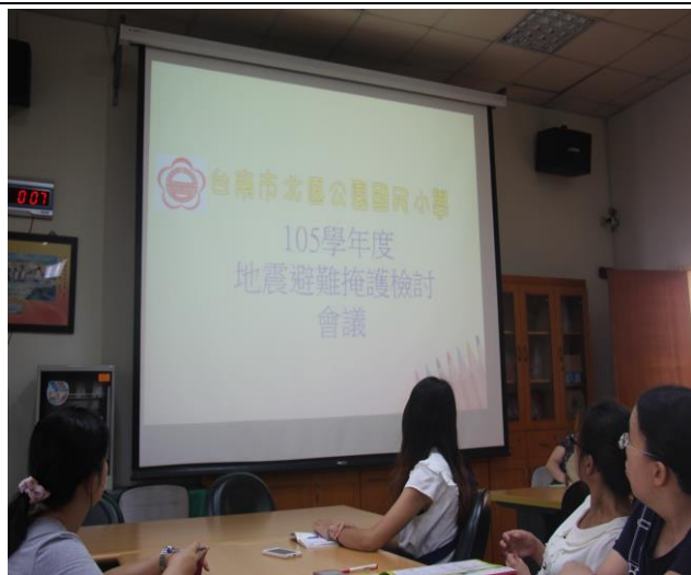
9/20 演練後指揮官、副指揮官和各組長開會