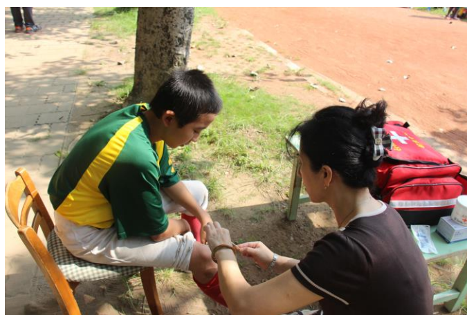
緊急救護組處理受傷學生。