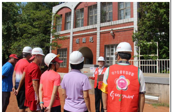
指揮官指示搶救組完成搶救工作。