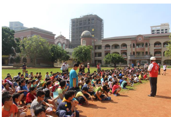
戶外安靜集合點名回報人數