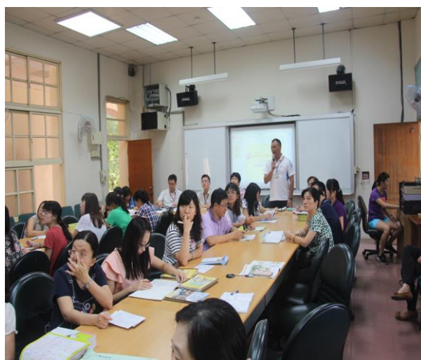
9/21 老師們討論提出學生的應變問題