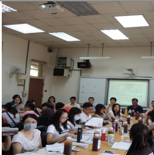
總指揮官任務分配