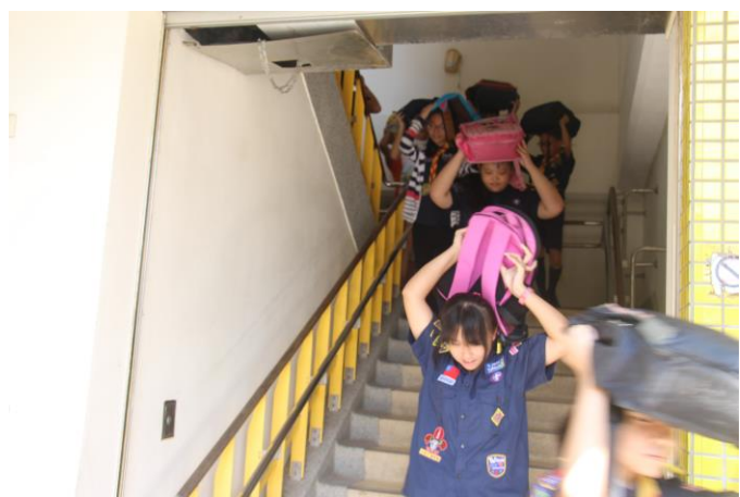
依指定路線進行疏散避難。