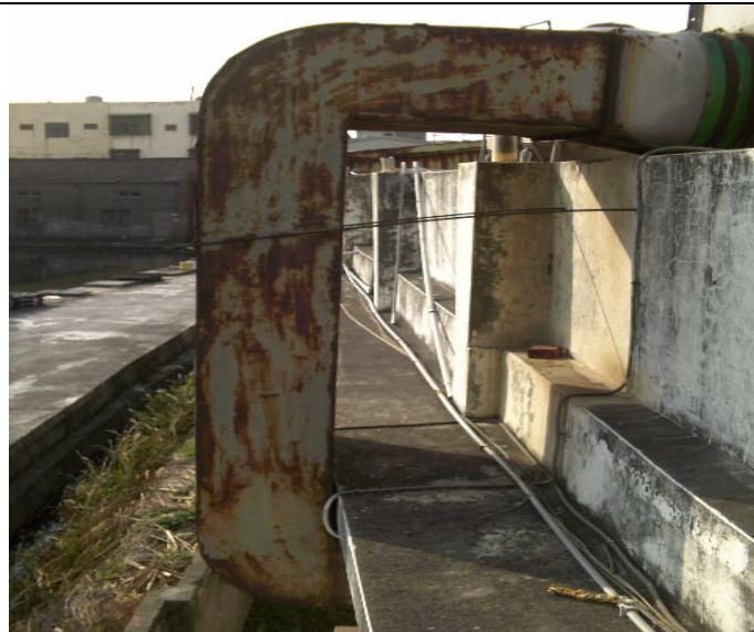
舊的鍍鋅風管 (施工前)