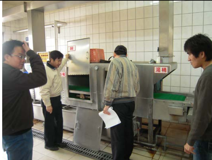
新的三槽式洗碗機輸送帶進行運作 (驗收成果)