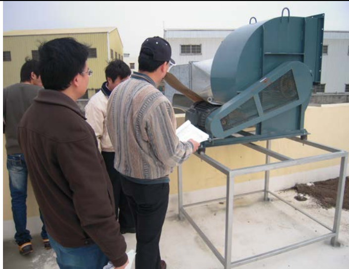
新的多異式強力風車進行運作 (驗收成果)