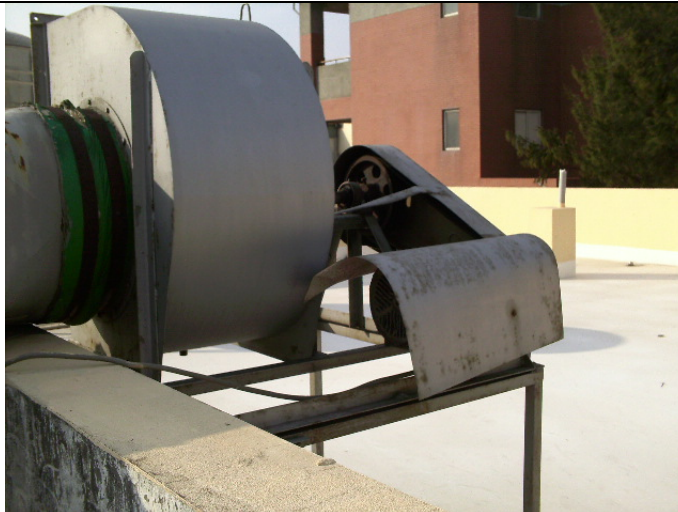
舊的多異式強力風車 (施工前)