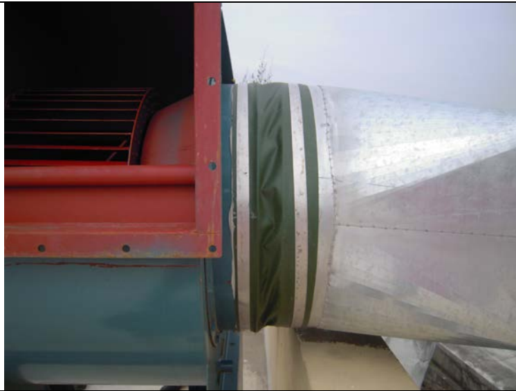
新的鍍鋅風管 (驗收成果)