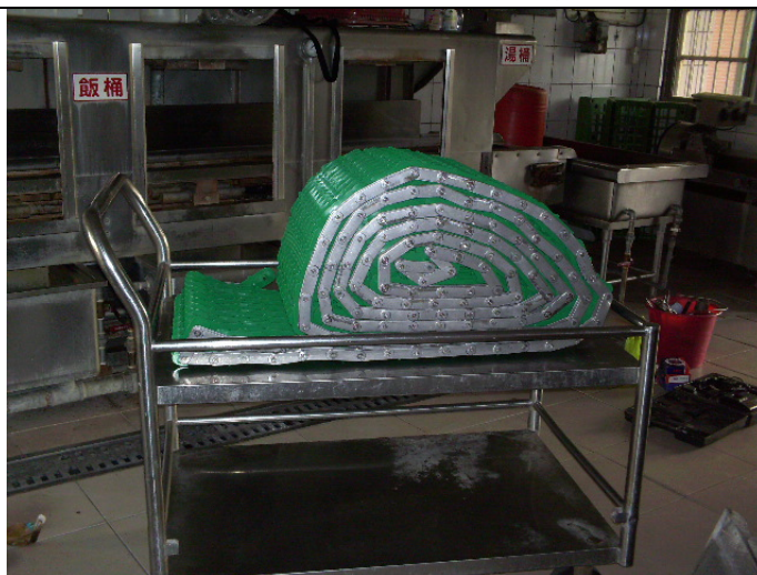
更換三槽式洗碗機輸送帶 (施工中)