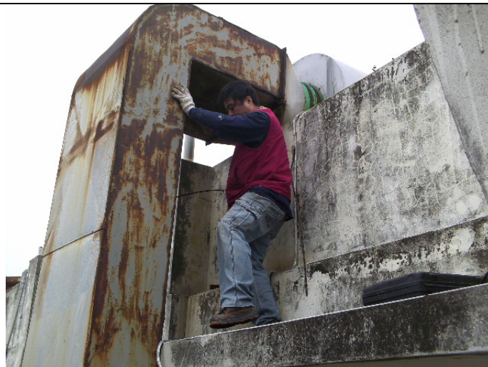
更換鍍鋅風管 (施工中)