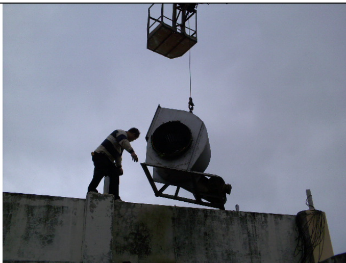
更換多異式強力風車 (施工中)