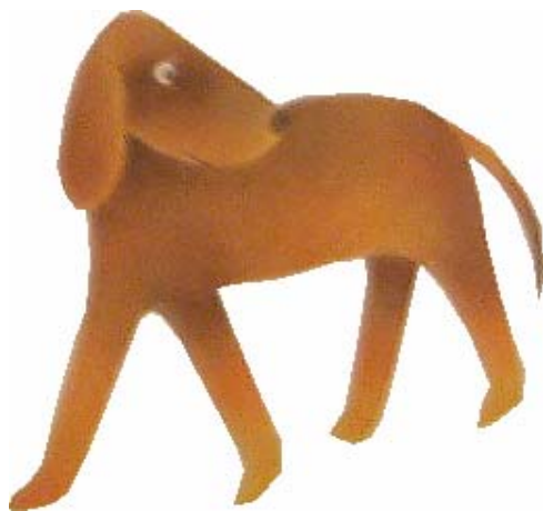
第二屆中華兒童寫作分級檢定比賽暨親子創作活動親子組專用圖像稿紙