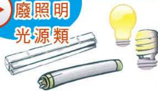
Disposed daylights lamps