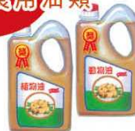
Disposed cooking oil